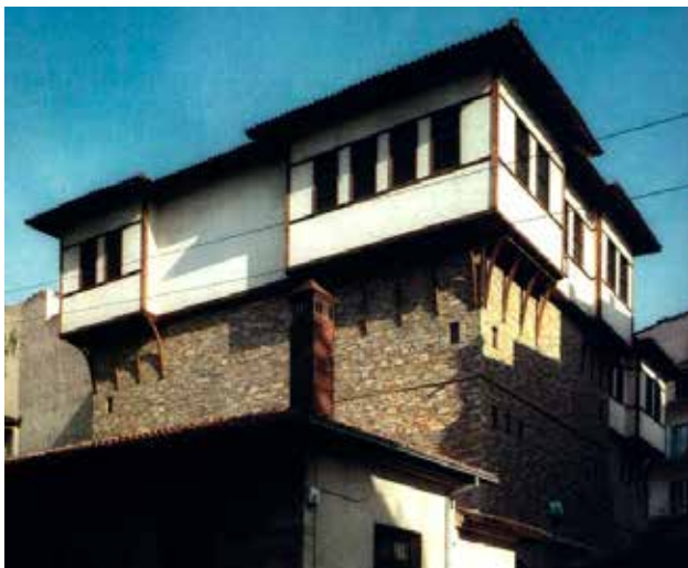
Сл.9 Куќа од Костур