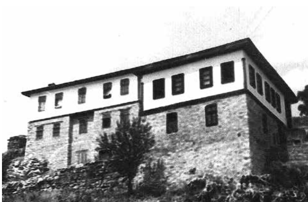
Сл.3 Куќи од Лазарополе

кови наназад се пренесувани на генерациите кои доаѓаат, најчесто во рамките на фамилијата. Основната дарба за обработката на каменот и дрвото, нивните логички врски во една стабилна градба, а особено чувството за естетика во применетите форми и склопови на применетите материјали, била постојано надоградувана и менувана, прилагодувана на потребите и барањата. Цврстиот и масивен камен во првото, односно во првите две нивоа, силно се спротивставува на бондручната конструкција на последното ниво, затворено, најчесто, со темно обработено дрво. Основната форма добиена со извонредно избалансираниот однос - контраст на масивно и лесно, на светло и темно, на камен и дрво, богато е надополнета со едноставни, но ефектни детали, со што се создава една извонредно складна целина. Оваа слика ја дополнуваат одлично изработените отвори на вратите, обработката на прозорските отвори, агловните камени блокови, еркерот и најживописниот елемент - ризалитите и аркадните ризалити.