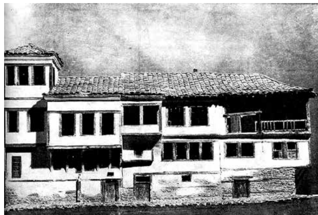
Сл.6 Куќи од Охрид

тров, го обработувале повеќе автори. Со цел да се добие целосна слика за нивната активност ќе бидат обработени сите центри на нивната активност поединечно.