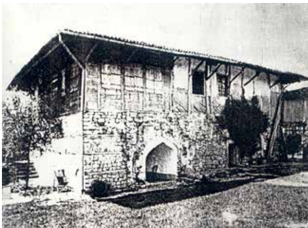
Сл.11 Куќа од Арбанаси