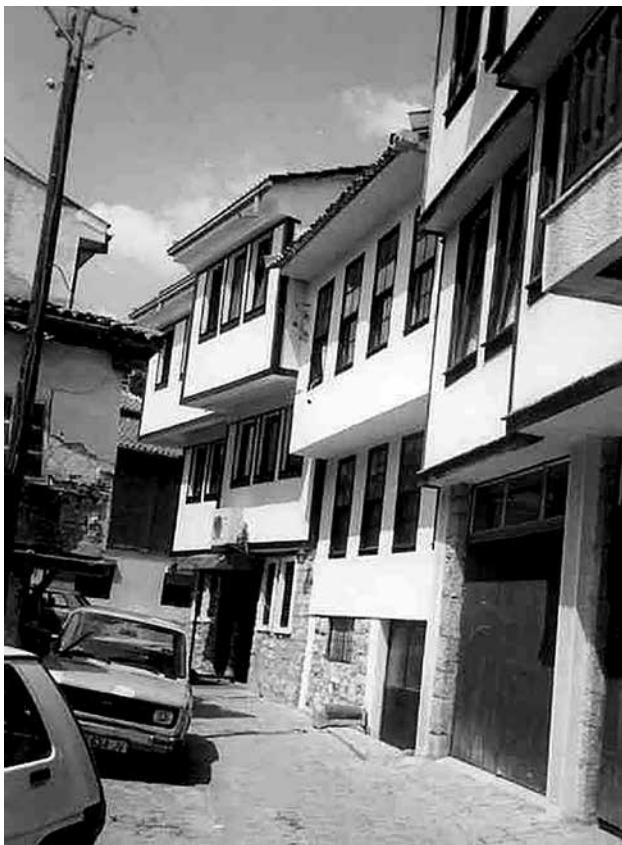
Сл.5 Куќи од Охрид

Македонија и Бугарија. Преселбите станале почести во XVIII век. Во Македонија тие ги населиле селата Папрадиште и Ореше во Велешкиот крај, Смилево во Битолскиот, Слупче и Еловце во Прилепскиот, Козјак во Кривопалянечкиот крај, како и во Крушево, каде се населиле заедно со Власите. Во Егејска Македонија најмногу се населуваа во Костурскиот крај, а оттаму се преселуваа во Тиквешката, Овче Поле, Радовиш, Струмица, Петрич, додека во Бугарија преселниците ги наоѓаа на целата територија. 1 Во сите краеве каде што се доселиле Мијаците, забележуваме силен развој на занаетите, кои тие особено ги познавале - градителството, резбарството и зографството.