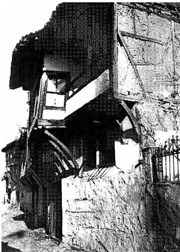
Сл.8 Кука од Велес