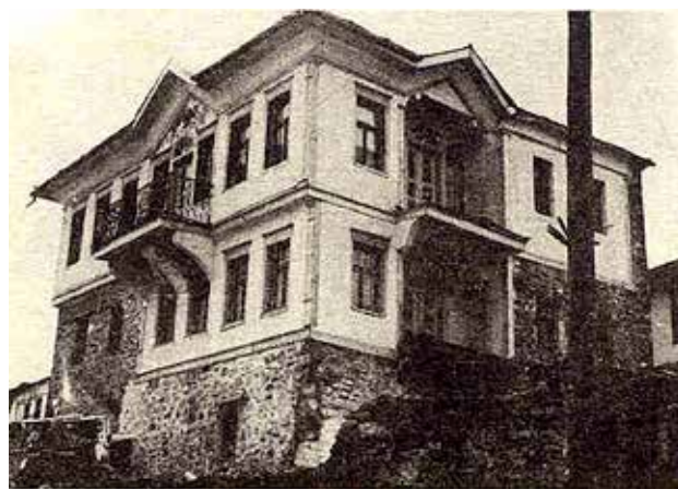
Сл.7 Куќа од Крушево