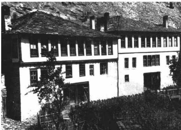
Сл.14 Куќи од Соколовци, Смоленско

ктивните елементи, така и во оформувањето на архитектонскиот детал. Љубовта спрема дрвото наоѓа достоинство место во градителството и украсувањето на многу творби од оваа школа. Но во неа се прават и сериозни истражувања за развојот на традициите и во адаптирањето кон потребите на новиот живот. Како резултат на творечките барања на мајсторите од оваа школа во архитектурата на црковните објекти се воведуваат значително помонументални форми од оние на традиционалните решенија. Во оформувањето на ентериерите се развиваат многубројни новини - полуцилиндрични апсиди, слепа купола, висечки арки, ажурен парапет, како средство за зголемување на визуелното и уметничко доживување на внатрешните простори. Без сомнение сето ова укажува на базичното влијание врз развојот на архитектурата не само во Македонија, туку и во соседните региони, каде што се поставени творечки контакти со мајсторите од другите школи. Во поглед на резбарството, за Дебарската резбарска школа, како што овој автор ја нарекува, изјавува: Богата и разноврсна е дејноста на Мијачките мајстори. Тие работат иконостаси и тавани на целиот Балкански Полуостров. Некои од нив стигнуваат дури и во Италија. Како е создадена Дебарската школа, кој е нејзиниот основач, не се знае точно. Можеби мајсторите од атонскиот и зографскиот манастир се првите оснивачи на школата. А можеби имало и месна традиција, па дејноста се развива како последица на тоа. 61