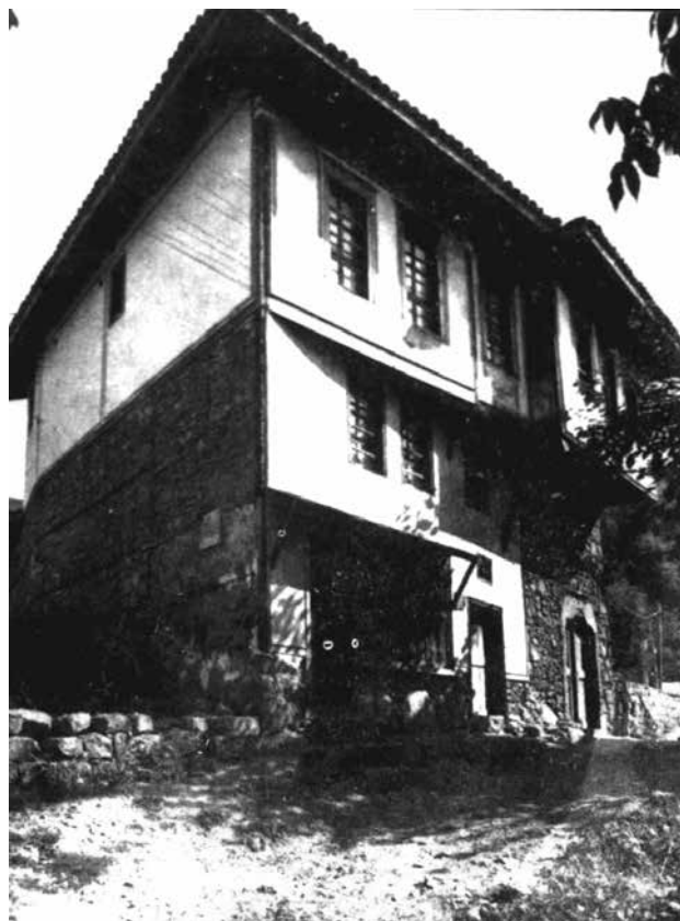
Сл.13 Куќа од Брацигово