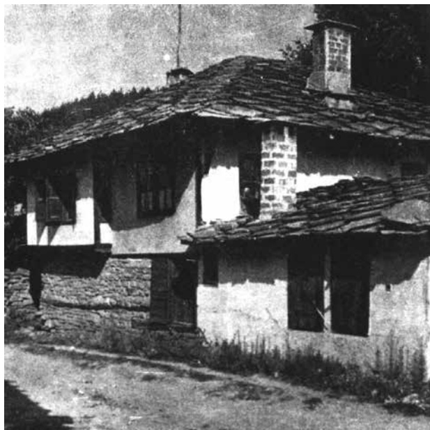
Сл.12 Куќа од Тревен