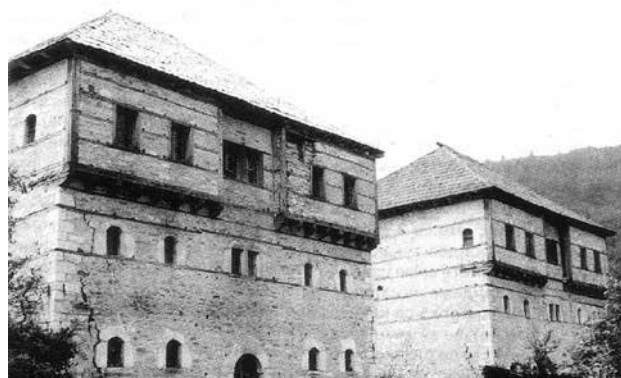
Сл.4 Куќи од Кучиница

Меѓутоа она што најмногу одушевува, тоа е прилагодувањето на објектите, промената на основниот тип, кој е евидентен секаде каде што можеме да го следиме градителството на овие мајстори. Климатските услови, топографијата на теренот, обичаите на месното население, често и желбите на инвеститорот се максимално почитувани, но сето тоа ни малку не ги намалува естетските вредности на објектот. Напротив во секое подрачје се создава различен и по своите особености карактеристичен лик на објект, во кој се вткајува особеноста на местото, односно се оформува препознатлива матрица на даденото место, слично на архетипската, која со мали модификации ги задоволувала широко поставените критериуми на квалитетен станбен простор. Постојано надоградувајќи ги своите искуства, особено на полето на естетиката, овие градители, во последната фаза на нивната богата дејност, се навраќаат на основните форми и отфрлајќи го еркерот, создаваат извонредно пропорционални призматични