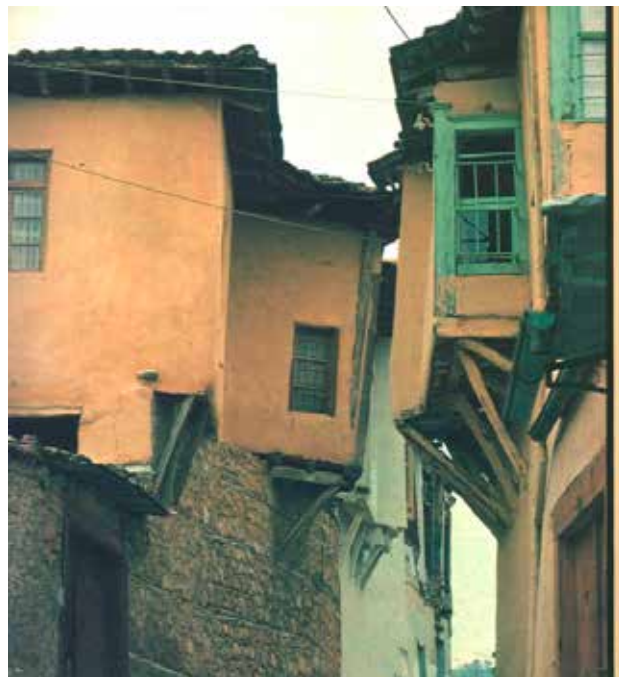
Сл.10 Куќи од Верија

Раптис 35 за селото Калевишта. Тоа се воедно и селата каде што има најмногу преселени фамилии од Мијачкиот крај.