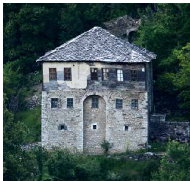
Сл.2 Кука од Галичник

Кога се зборува за градителството во овој крај се наметнува констатацијата дека се работи за една исклучителна појава, која е длабоко вкоренета во нивното битие. Затоа може и да се зборува за карактеристиките - особина, вештина, кои со ве-