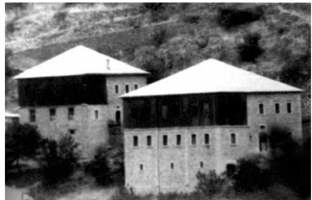
Сл.1 Куки од Галичник

При анализата на градителството и градителските традиции во Македонија, и пошироко на Балканот, сите автори се согласуваат дека Мијачкиот крај е местото од каде што потекнува плејада мајстори - градители. Неколкугодишните истражувања на терен, недвосмислено упатија на нивниот особено различен начин на градба и однос кон градителството воопшто. Во минатото, во сите краишта на Македонија, селската кука ја задржала својата утилитарност, изградена од месните мајстори или од самиот сопственик, од материјалите кои ги има во најблиската околина, ослободена најчесто од декоративните елементи, освен оние кои ги создава основната форма или конструктивниот елемент. Меѓутоа она што уште во првиот момент може да се забележи при посетата на селата на Мијаци е еден посебен однос кон кука и градбата воопшто. Исконскиот однос кој поединецот го носи во себе кон домот, а особено односот на мајсторот кон градбата, нејзината